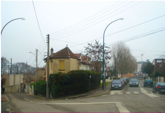
Ici, en zone urbaine, dans le quartier du Noyer Doré en cours de processus ANRU, RFF envisage d'implanter le tunnel d'interconnexion sud, inacceptable pour les riverains !

échanges intermodaux fer-air à la gare TGV d'Orly pour 32 millions de passagers aériens. Par ailleurs, il est illusoire de penser que la structure des dessertes aériennes sur Orly pourrait se modifier : on ne fera heureusement pas d'Orly, qui est très fortement insérée dans le tissu urbain et donc soumise à un couvre-feu entre minuit et 6 heures, un second aéroport intercontinental parisien.