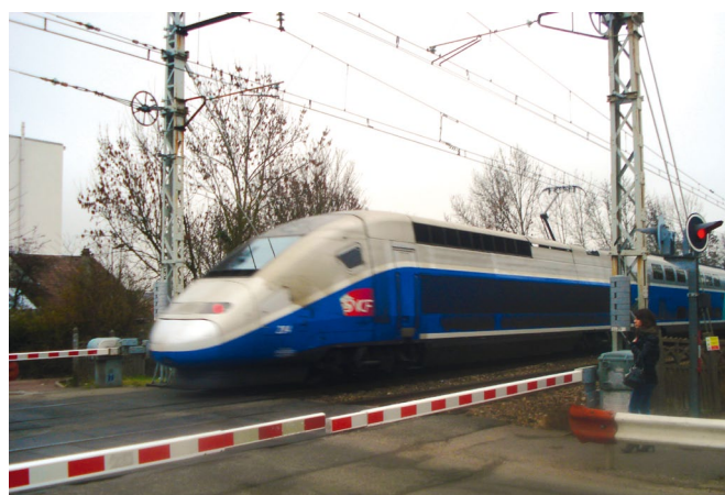
Le TGV au passage à niveau Michalon à Antony en pleine zone urbaine.

A l'heure actuelle, il ne devrait plus être question pour personne d'acheminer du fret lourd et parfois dangereux au cœur des villes par le rail. Dans la mesure où, sauf exception, la logistique des derniers kilomètres ne peut se faire que par voie routière, il convient de privilégier des pôles multimodaux en grande banlieue qui offrent la possibilité d'y éclater les chargements ou, pour quelques gros clients particuliers, d'assurer un relais fluvial. Le projet d'autoroute ferroviaire Atlantique-Ecofret est ainsi prévu de déboucher sur la plateforme de Brétigny. Dans cette conception, les transports de fret par voie ferrée en petite couronne devraient être évités puisque inutiles.