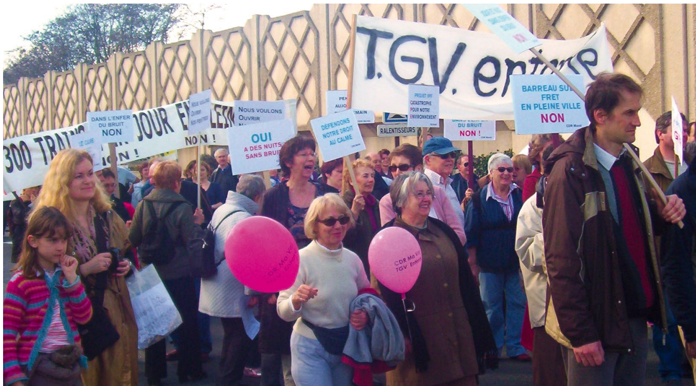
Manifestation en 2004, les riverains refusent le projet d'aménagement de la ligne Massy-Valenton, 3 500 riverains signeront une pétition exigeant l'enfouissement de la ligne TGV.

rationalisation du fret), est digne d'intérêt à condition qu'il respecte les habitants et les territoires concernés.